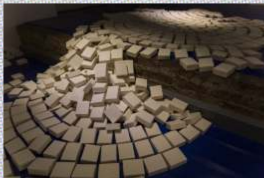
Hera Büyükaşçıyan: In Situ. Site specific installation view, soap, vinyl PIST// Interdisciplinary Project Space, Istanbul, 2013. Photo credit: PIST / Porträt Hera Büyükaşçıyan: Silvana der Meguerditchian

Künstlertgespräch mit Hera Büyükaşçıyan (Istanbul), Teilnehmerin des Armenischen Pavillons auf der 56. Biennale in Venedig 21. November, 19.00 Uhr, Haus der Kunst