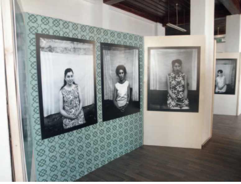
Dr. Rıza Nur Kitaplığı, Sinop Pasaport Fotoğrafları sergisi Sinopale 4'te sergilenmiştir.