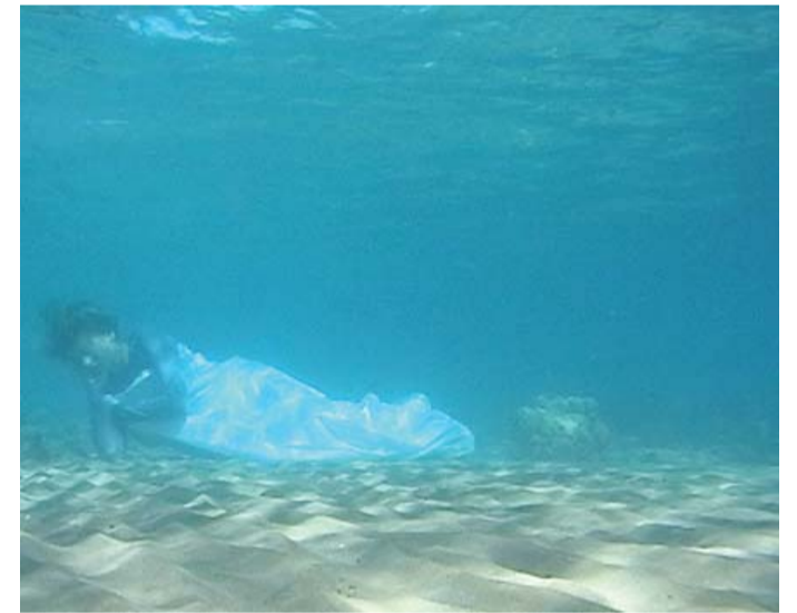
Isabel Haase Dudong gibi uyumak / Sleeping like a Dudong, 2008