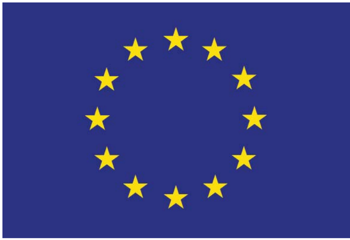
Christian Engelmann EU-Kreuz, 2009