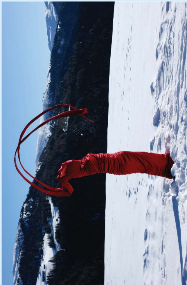
Nezaket Ekici Tüp / Tube, 2009